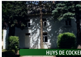
HUYS DE COCKER