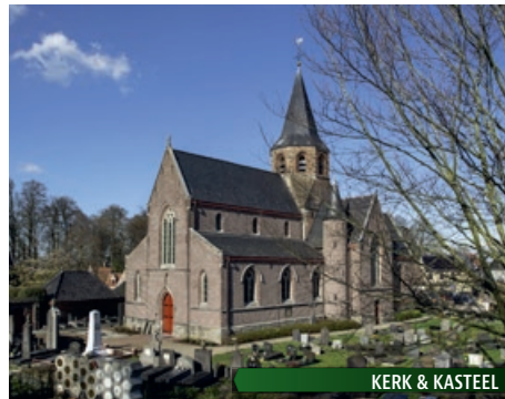
KERK & KASTEEL

De Sint-Martinuskerk kreeg de afgelopen jaren een grondige opknapbeurt en vervult een nieuwe rol als ontmoetingsplek en stille ruimte. Het is de eerste kerk in Merelbeke die zo een nieuwe invulling krijgt waarbij de ruimte wordt teruggegeven aan de gemeenschap.