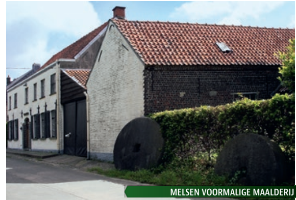
MELSEN VOORMALIGE MAALDERIJ