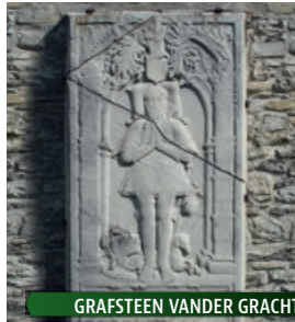
GRAFSTEEN VANDER GRACHT