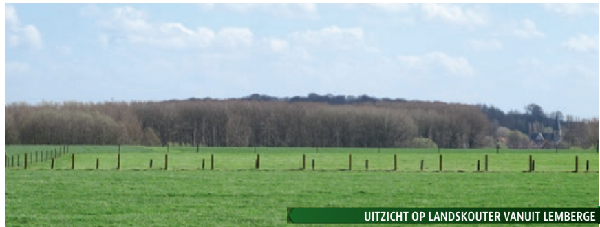
UITZICHT OP LANDSKOUTER VANUIT LEMBERGE