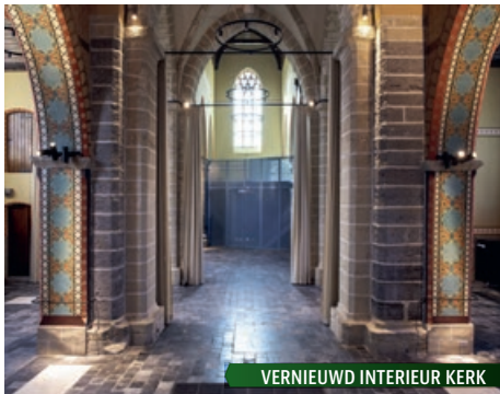
VERNIEUWD INTERIEUR KERK

Het is een mooi kasteeldorp met een beschermd dorpsgezicht en tal van beschermde monumenten.