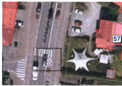
Hundelgemsesteenweg 57-1engte: arcering tot aan boomspiegel