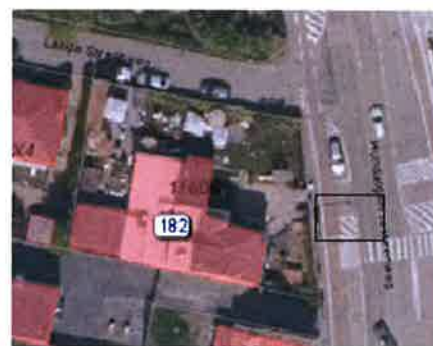
Hundelgemsesteenweg 182-1engte: arcering tot aan oort