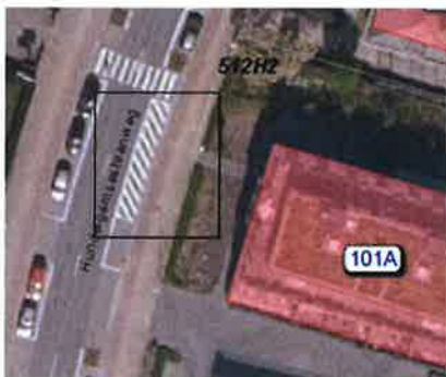
Hundelgemsesteenweg 101A/101C-1engte: arcering 15,00 m